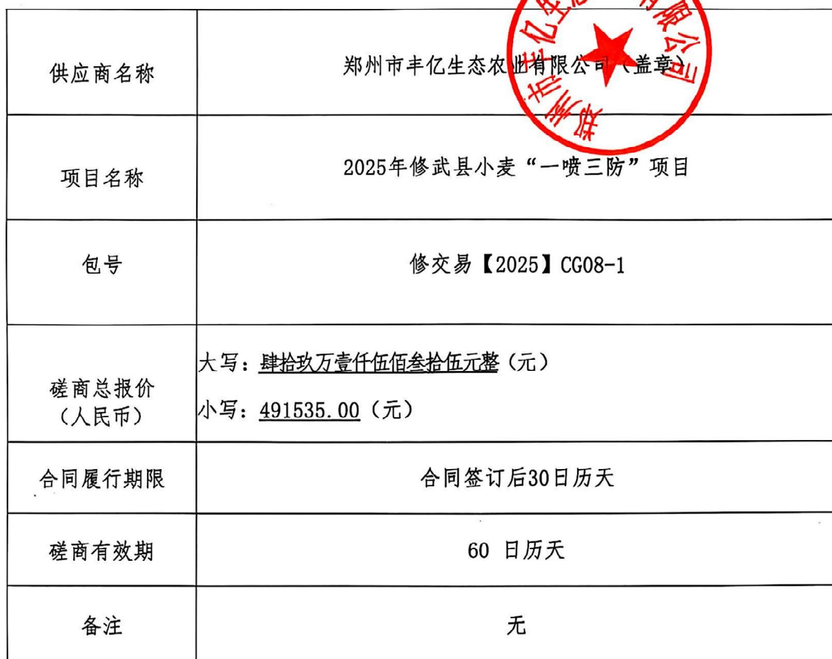
第二轮报价一览表