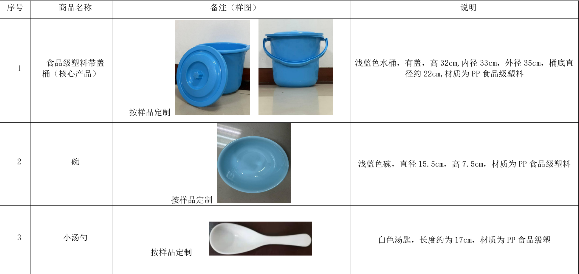
附件：包 2 定制部分日用百货清单